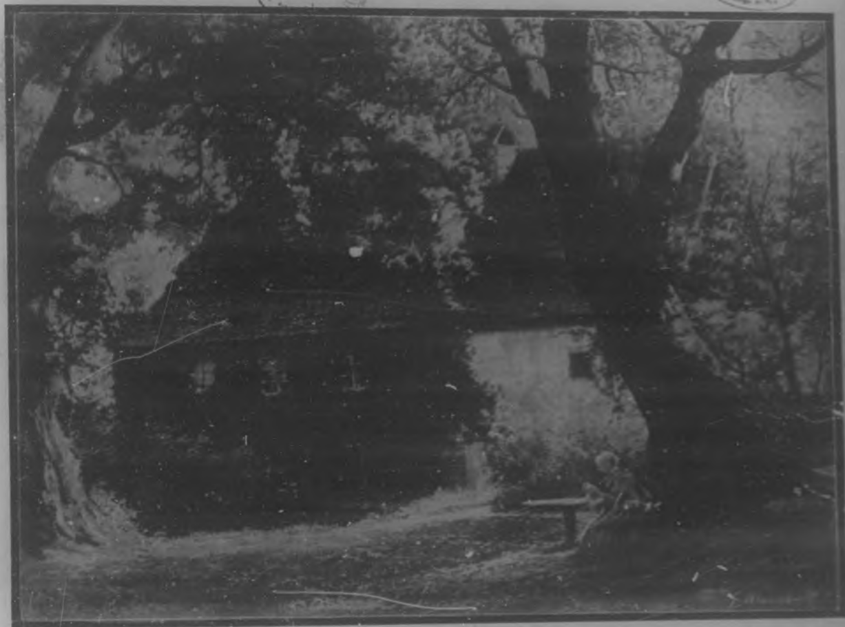
LA CASA DE CAMPO Oleo de Georg Marschall.

ESTABLECIMIENTO NUM. 1077000 C. BARRIO DE LOS