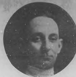
ROGER DE LAURIA