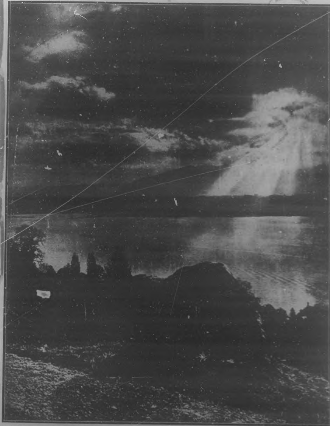
UN HOMENAJE A LA MEMORIA DE BYRON.—Roca situada a la orilla del lago Lemán, donde el famoso poeta inglés iba todos los años a contemplar el bello espectáculo ofrecido por el lago. La roca ha sido declarada monumento nacional por la ciudad de Ginebra.

Redacción, Administración y Talleres: Edificio de BOHEMIA, América Latina (entre Troncales y números 80, 82 y 84). Teléfono: Dirección, M-122; Administración, A-5658.