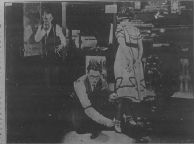
EL ESTRENO DE "TERROR A LAS MUJERES".—Una de las más hilarantes escenas de "Terror a las Mujeres", última película de Harold Lloyd, estrenada el miércoles en "Capitolio" con éxito extraordinario.

Bella y notable danzarina que en el "Principal de la Comedia" ha ofrecido dos exhibiciones de sus exóticas danzas, alcanzando muy halagüeño éxito.